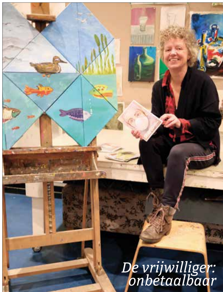
De vrijwilliger: onbetaalbaar

"De twee mannelijke vrijwilligers doen het zware werk: vegen, stofzuigen en dweilen. Mijn vrouwelijke collega en ik maken de tafels, schilder-