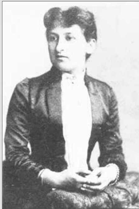
HET GEHEUGEN SPANNESTAD/INT. INSTITUUT VOOR SOCIALE GESCHIEDENIS

een gratis cursus voor vrouwen over hygiëne, het verzorgen van baby's en seksuele voorlichting. Ze was ook lid van de Neo-Malthusiaanse Bond (voorloper van de NVSH).